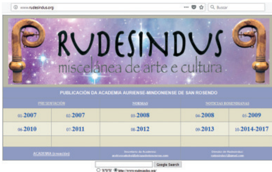
Páxina web da revista RUDESINDUS , realizada polo director da revista, don Alfredo Erias Martínez a finais de 2017.

Non se trata dunha pretenciosa e desmedida meta, senón dun marco serio e nobre para dignificar unhas actividades que desexamos non sexan un innecesario adorno, senón un estímulo e un apoio para facer presente a fe cristiá na historia e cultura de Galicia.