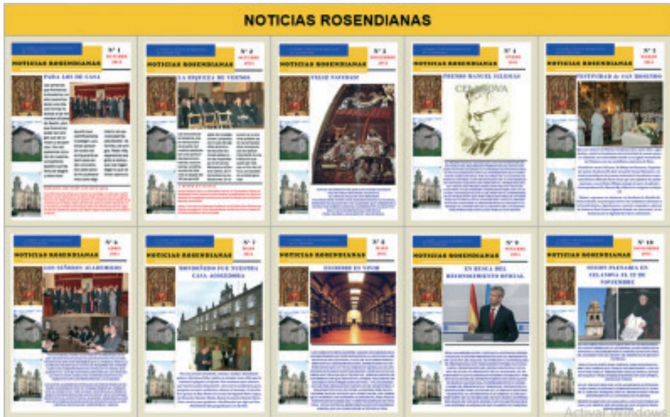
NOTICIAS ROSENDIANAS é unha publicación da Academia Auriense-Mindoniense de San Rosendo, realizada na secretaría da mesma por don Miguel Ángel González García desde o 1 de outubro de 2013.

Ofrécesenos aquí un amplo campo para o diálogo entre a fe e a cultura na súa raíz xenuína e orixinal. Dicimos xenuína porque na cultura exprésase o universal e particular do home como posibilidade e realización. Dicimos orixinal porque exprésase o propio e específico do home nas súas dimensións máis reais e auténticas. A fe, vista desde ese horizonte, compromete ao home na totalidade do seu ser e das súas aspiracións. Unha fe que se sitúa na marxe do humano e, polo tanto, da cultura, sería infiel á plenitude de canto a palabra de Deus manifesta e revela, unha fe decapitada, máis aínda, unha fe en proceso de autodisolución.