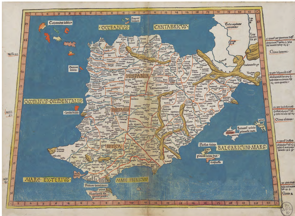
Ptolomeo, Claudio, 100-178. Secvnda Evrope tabula continet Hispaniam totam [Material cartográfico] / [Claudio Ptolomeo; Nicolaus Germanus]. Escala indeterminada. - [Ulmae] : [Leonardus Holle], 16 julio, 1482. 1 mapa : grab., col. ; 38 x 52,5 cm.

“cualquier mapa que ya no sirve para el propósito con el que fue producido y que ahora tiene solo un interés histórico o artístico”. Por tanto, no se trata de un tema cronológico, sino de vigencia.