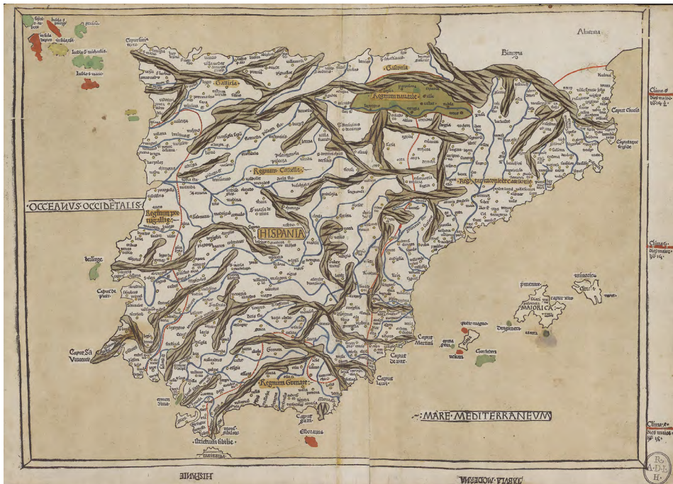
Nicolaus Germanus, ca. 1420-Ca. 1490. Tabula Moderna Hispanie [Material cartográfico] / [Nicolaus Germanus]. Escala indeterminada. - [Ulmae] : [Johannes Reger], [21 julio, 1486], (Impens. Justi de Albano). 1 mapa : grab., col. ; 41 x 57 cm.

Boletín Oficial del Estado y los registros del catálogo con su imagen, en la Biblioteca Digital de la Real Academia de la Historia.